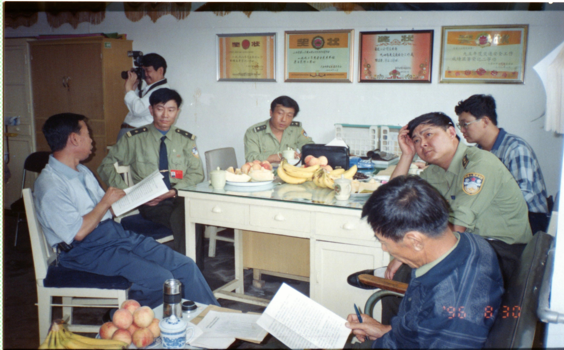
图为武乡县公安局交通警察大队组织当地企业到二公司参观学习

当时，我在山西二建车管科当科长，管理公司 200 多台机动车和 300 多名驾驶员。那时候这个规模在太原市算是大户，很让人眼红的。尤其是连续十四年荣获太原市交通安全先进单位，荣立集体二等功三次、三等功多次，表彰的锦旗和奖状，办公室墙上转圈挂了个满满当当，各地、市参观学习的队伍接二连三，络绎不绝，成了公司和驻地一道亮丽的风景线。